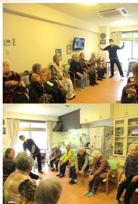
機能訓練(集団体操)