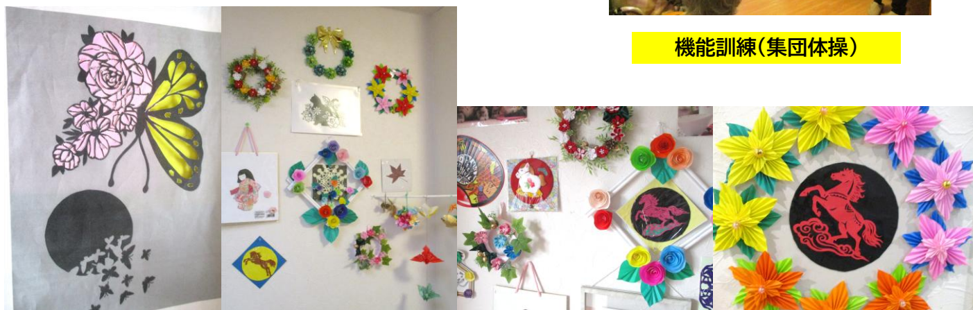
切り絵・折り紙作品(趣味活動として、きれいで立派な作品が増えております)