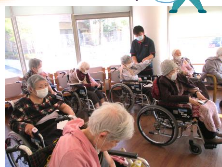
コロナウイルスワクチン接種