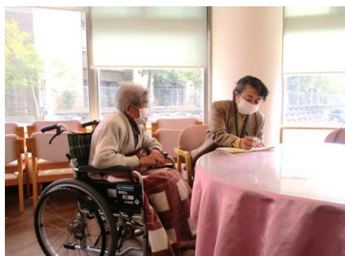
鹿児島市介護サービス相談員派遣事業